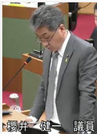
桜井 健一 議員

A 総務部長 災害時には、議員個人と市災害対策本部ではなく、市議会と市災害対策本部がうまく連携できる仕組みが必要であり、それが議員の役割につながるものではないかと考えます。