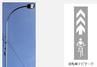
自転車ナビマーク